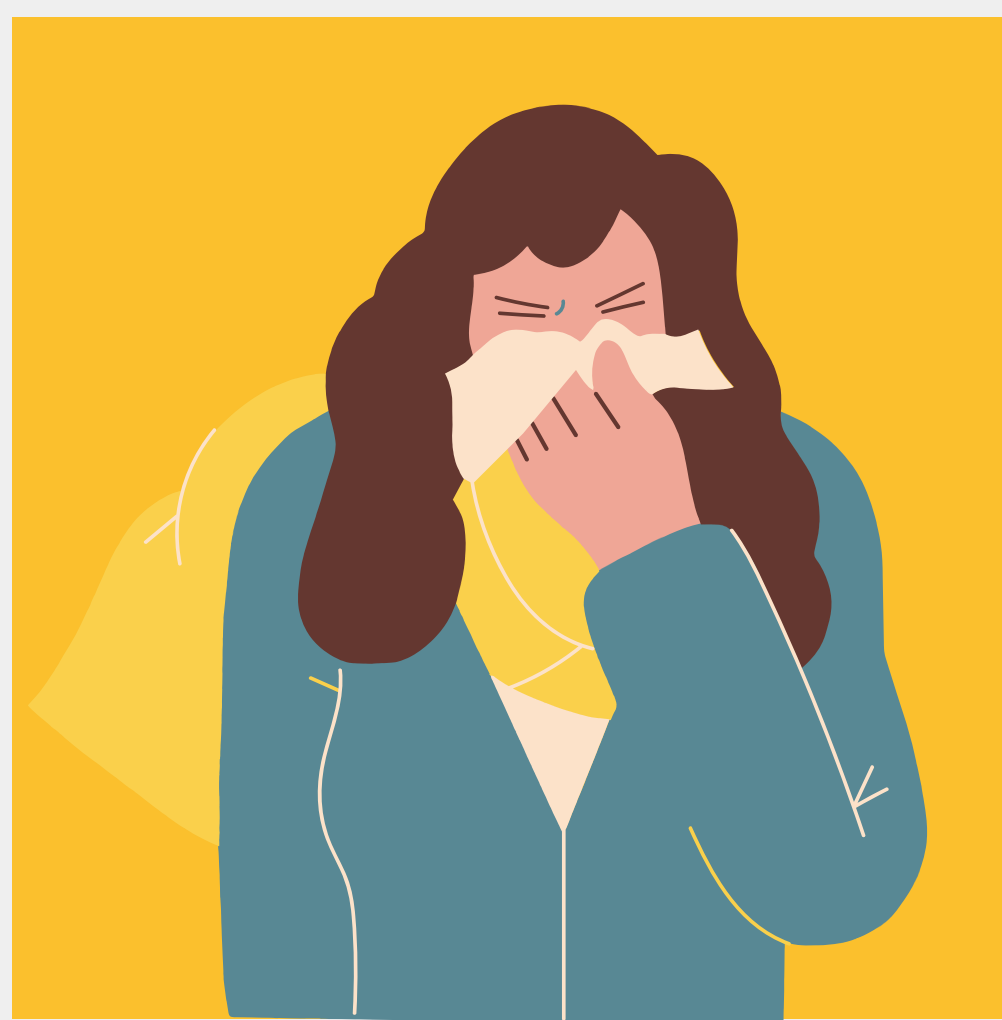
Medição de temperatura e impedimento da presença de alunos e funcionários com sintomas