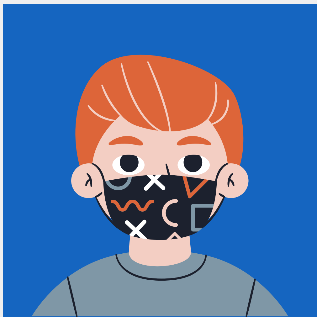
Uso de máscara por professores e funcionários